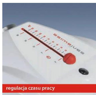
regulacja czasu pracy